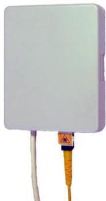
Gniazdo abonenckie serii CTB2-A

Gniazda abonenckie serii CTB2-A przeznaczone są jako zakończenie linii abonenckiej.